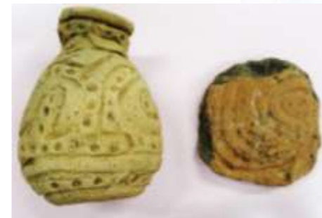
鐸形土製品と円盤状土製品 Sake-shaped and disk-shaped soil

この住居は7本の主柱を立て、桁(けた)をかけ、それに斜め材を立てかけて、建てられていました。集落の初めころの家です。