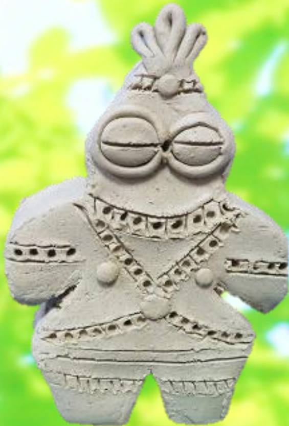
遮光器土偶 作品見本

土偶は縄文時代につくられた土製の人形です。乳房やくびれがあり、女性をかたどったものと言われています。祈禱や呪術に使った、ひとがた（身代わり）にした等、様々な説があります。