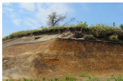
生痕化石と古砂丘観察