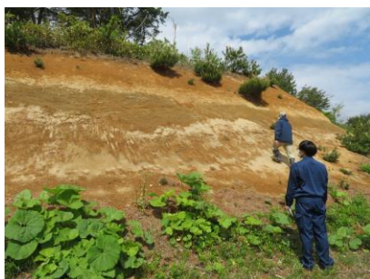
約 2 万年前の火山灰層の観察