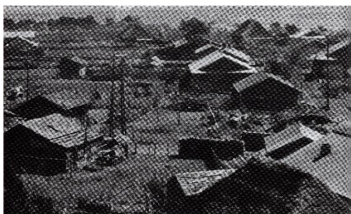
尾駮の集落 1960(昭和35)年