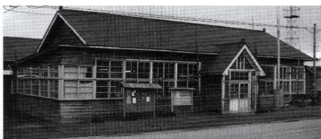
尾駮移転の村役場 1960(昭和35)年