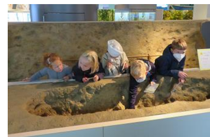
子どもたちは縄文美子や落とし穴に興味津々でした。