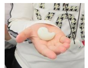
滑石を削って勾玉をつくりました。