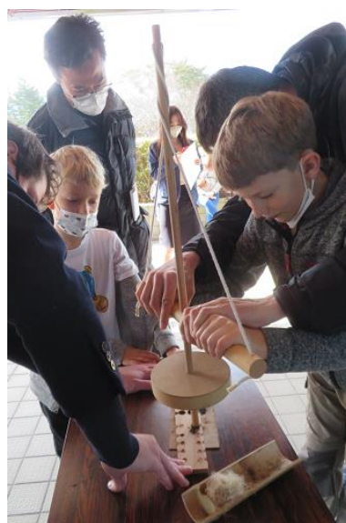
マイギリ式火起こし器で火起こしにチャレンジしました。