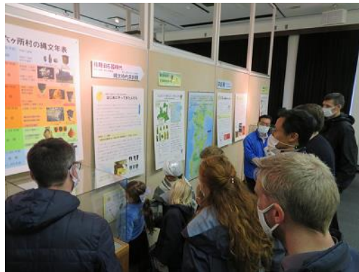
館内の展示や屋外の復元住居の解説を熱心に聞く参加者たち