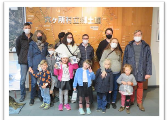
最後にみんなで記念撮影♪