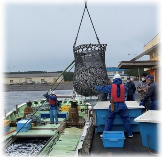
船からイワシが上がる様子