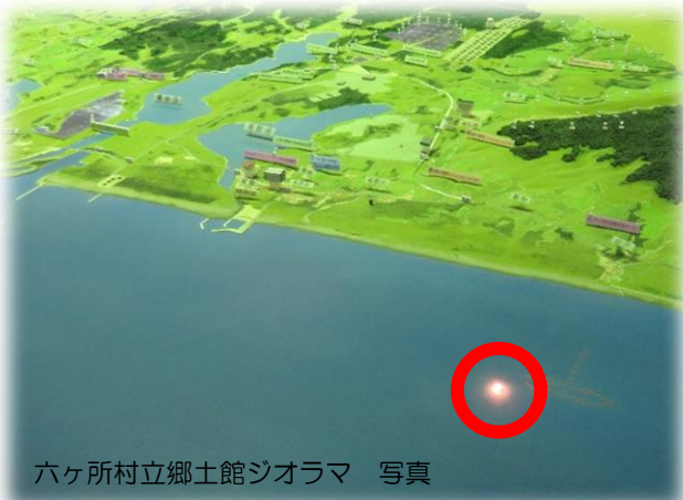
六ヶ所村立郷土館ジオラマ 写真