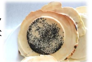
自分だけのオリジナルせんべい

内容 六ヶ所村でも大正時代から南部せんべいが食されていました。鉄製の焼き型を使って、伝統的な白せんべいや好きな具材を入れたオリジナルせんべいを焼いてみませんか?