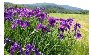
ノハナショウブの群落