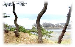
大砲場跡から海を臨む

中山崎の砲台跡3カ所を散策します。中山崎の中程には、当時の砲台跡が絵図の通り、現在でも残っています。砲台跡からの眺めをご覧ください。