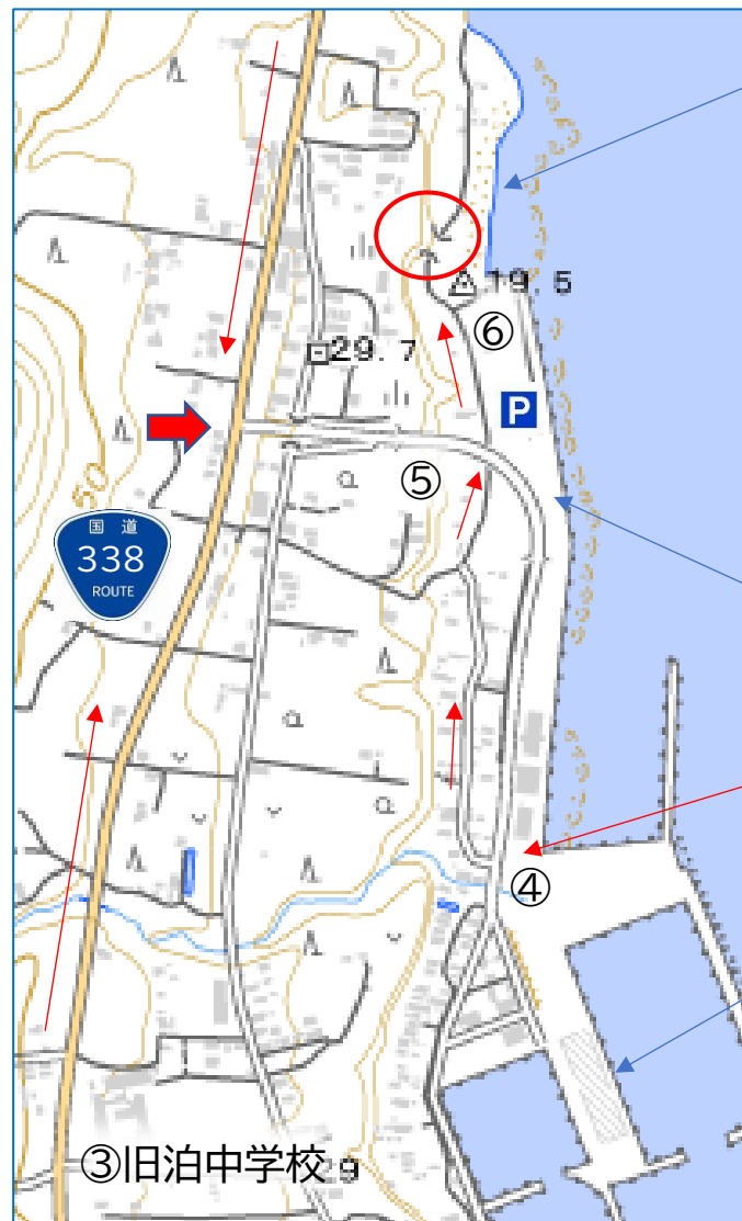
弥次郎穴へのルート案内図

今、SNS で話題になっている弥次郎穴への行き方は、①むつ市からは、国道338号線を、東通村白糠地区を目指し南下します。白糠・泊トンネルを抜けると左側に焼山大橋が見え、左折します。②八戸側からは六ヶ所村役場前を北上し、泊地区焼山漁港を目指し、泊地区に近づくとコンビニの所から Y 字路があり、右は旧市街地で、左の国道338号線のバイパスを進みます。途中信号とコンビニ、泊小中学校を右手に見ながら北上します。③しばらく行くと右手に旧泊中学校の大きな看板を見ながら約500m進むと、焼山大橋が右手に見え、右折します。④橋を下りてすぐ右側を逆方向に折り返します。⑤道なりに大橋の下をくぐり、空き地に車を止めます。⑥採石を敷いてある昆布干し場を右に見ながら道なりに北上すると、小さな社が見え10mくらいで「弥次郎穴」につきます。穴の手前で、道路すぐ左側に立って岩穴を見ると???道路中央に立つと???右側からは???いろいろな形に見られますよ。また、6月頃にはスカシユリ、10月頃にはコハマギクなど、美しい草花が見られます。