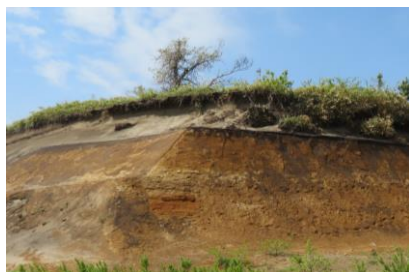
生痕化石と古砂丘観察