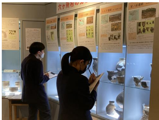
調べ学習をする生徒