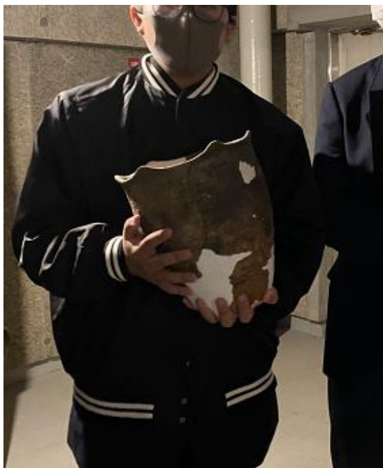
地下収蔵庫で本物の土器を持つ生徒

村には遺跡がたくさんあることに驚きました。縄文時代だけでなく、弥生や平安の遺跡があることを初めて知りました。