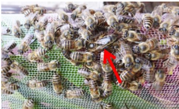
ニホンミツバチ：女王蜂 (赤矢印)

若い働き蜂(羽化後12日目から 20日目ぐらい)は、巣に貯められたハチミツを食べて、体の中でたくさん蝋(ミツロウ)を作ることができ、お腹から分泌されたミツロウで巣を作ります。