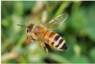
セイヨウミツバチ

してからの寿命は、女王蜂で 1~3年ぐらい、働き蜂は 15~140日、オス蜂は 21~32日といわれています。