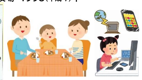
テーブルにイスでの食事 ネット時代へ