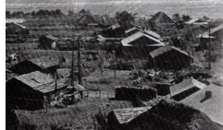
尾駮の集落と村役場 1960(昭和35年)