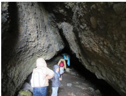
昨年の10月はいませんでした。

大穴洞窟に行ってみると、飛んでいました。コウモリが! 4月10日の泊海岸トレッキングでは、コウモリはぶら下がり、熟睡しているようでした。今回は、元気に洞窟を飛び回っておりました。六ヶ所村「大穴洞窟遺跡およびコウモリ」として、天然記念物に指定されてもいいくらいの、貴重な環境と生き物です。何というコウモリかは、現在、県立郷土館の方に確認をお願いしておりました。6月27日(日)開催予定の泊海岸トレッキングツアーでは、ご報告できるのではないかと思います。お楽しみに!