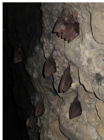
4月はみんな寝ていました! 冬眠中?