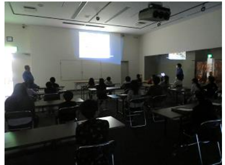
富ノ沢遺跡発掘の様子DVD鑑賞