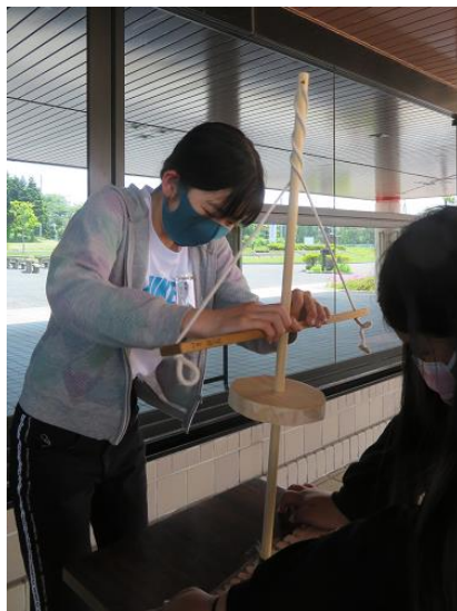
マイギリ式火起こし体験