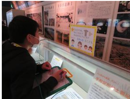
クイズラリーに挑戦!