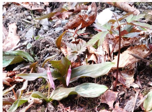
キクザキイチゲとカタクリ