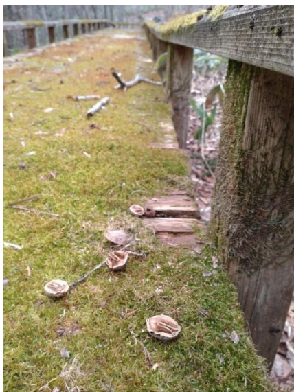
リスが食べたクルミの殻