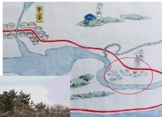
平沼砲台場「北奥道中図」より引用