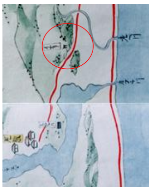
鷺森砲台場 「北奥道中図」より引用