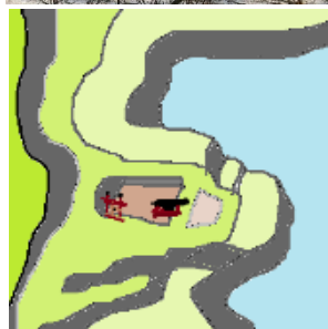
鷺森砲台場の想像図と遠景