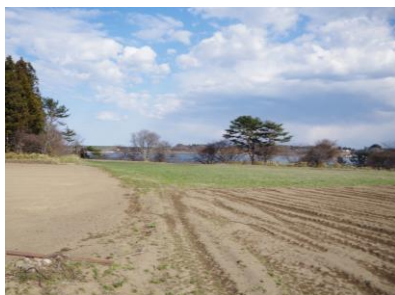
田面木沼貝塚遠景