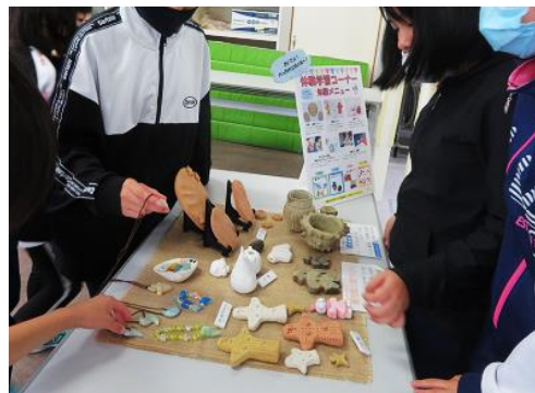
ものづくり体験学習の見本