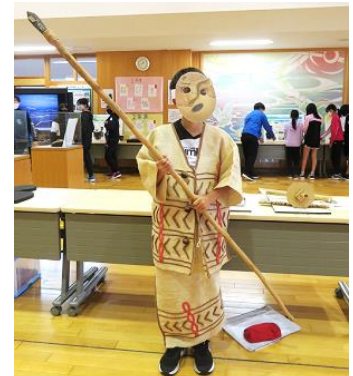
編布（縄文の服）を着て記念撮影♪

尾駮小学校と南小学校では、5 時間目に 6 年生を対象とした出前授業も行いました。児童たちは、六ヶ所村には縄文 1 万年の歴史があることや、弥生時代や平安時代の遺跡もあることなどを学習していました。