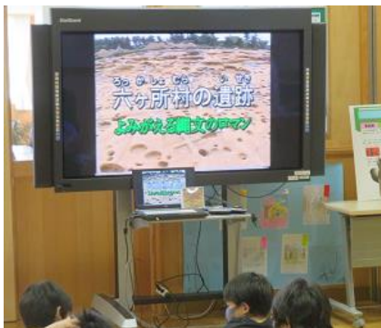
富ノ沢遺跡の DVD 上映