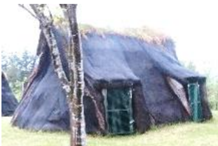
第108号竪穴住居跡の復元住居